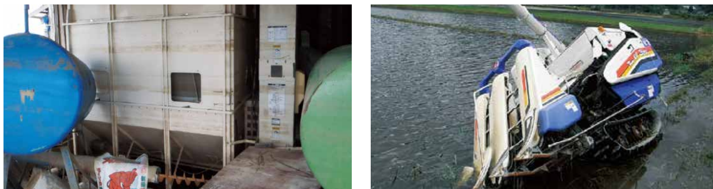
※令和元年10月13日の台風19号による被害